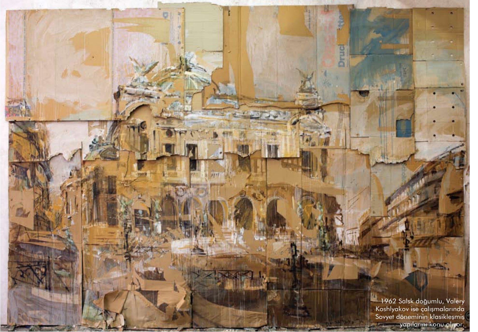
1962 Salsk doğumlu, Valery Koshlyakov ise çalışmalarında Sovyet döneminin klasikleşmiş yapılarını konu alıyor.