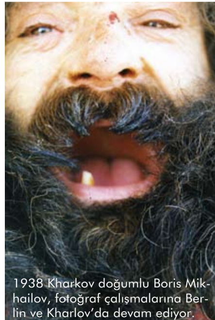
1938 Kharkov doğumlu Boris Mikhailov, fotoğraf çalışmalarına Berlin ve Kharlov'da devam ediyor.