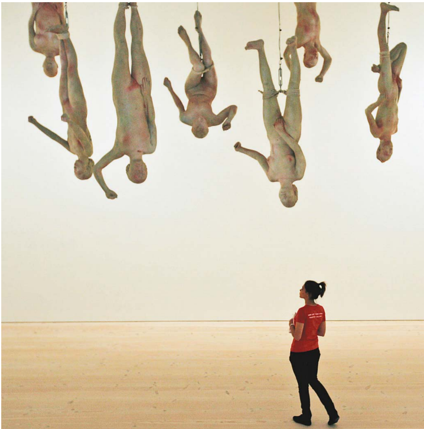
Heute spielen wir Baselitz mit Puppen: die Arbeit „Chinese Offspring“ des Chinesen Zhang Dali in der neuen Saatchi Gallery.

Doch die Furore, die die Werke in den ersten Jahren machten, als London noch